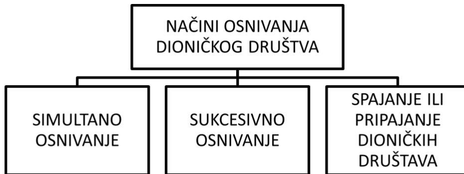
Slika 2 - načini osnivanja dioničkog društva