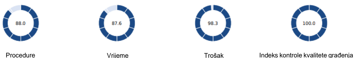
SLIKA 5: Rezultati rješavanja građevinskih dozvola u Hong Kong

OSC osoba dobiva relevantne potvrde i dozvole kao što su Potvrda vatrogasne službe, Dozvola za korištenje, Potvrda o usklađenosti i Potvrda o opskrbi vodom. Na kraju, OSC koordinira zajedničku i konačnu inspekciju relevantnih tijela za izdavanje licenci. Tijekom ovog procesa, također se postiže priključak na vodu, što se obavlja tijekom konačne inspekcije. Ovisno o ispunjenju tehničkih uvjeta, priključak na vodu može se dobiti istog dana. Ovaj sveobuhvatni proces omogućuje osobi da dobije sve potrebne građevinske dozvole i potvrde uz koordinaciju putem One Stop Centra, čime se olakšava administrativna strana građevinskih projekata u Hong Kongu. Sveukupan trošak dobivanja građevinske dozvole iznosi otprilike 8200 eura te traje 69 dana.