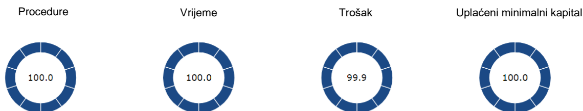
SLIKA 3. Ocjene osnivanja poduzeća

obrazaca za suglasnost putem faksa. Nakon što svi obrasci budu prihvaćeni, tvrtka će primiti potvrdu o osnivanju putem e-pošte. Osnivanje poduzeća sveukupno traje jedan dan te se u potpunosti može obaviti online.