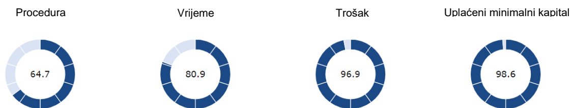
SLIKA 2: Ocjene osnivanja poduzeća

Prema arhivi World bank (bez dat.) Hrvatska je pozicionirana na 114 mjestu prema indikatorima za osnivanje poduzeća. Proces osnivanja traje ukupno 19.5 dana uzimajući u obzir da je za svaku proceduru potrebno minimalno jedan dan te se idući proces može obaviti tek dan poslije obavljenog prethodnog procesa. Iznimke su procedure koje se mogu obaviti online te se one zbrajaju kao pola dana.