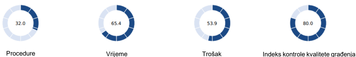
SLIKA 4: Rezultati rješavanja građevinskih dozvola u Hrvatskoj

Prije početka građevinskih radova, investitor će obavijestiti građevinsku kontrolu o svojim planovima. Građevinska kontrola će dalje obavijestiti različite nadležne institucije, uključujući Ministarstvo unutarnjih poslova, građevinsku inspekciju, inspekciju rada te tijela odgovorna za komunalne i vodne naknade. Građevinska inspekcija će provoditi inspekcije na gradilištu kako bi osigurala da izgradnja bude u skladu sa zakonima i propisima. Inspekcije će biti slučajne i mogu se provoditi više puta tijekom procesa gradnje. Nakon uspješnog izvršenja svih tih koraka i provođenja konačne inspekcije, općina će izdati uporabnu dozvolu koja omogućava upotrebu završene zgrade. Ova dozvola se izdaje nakon dostavljanja svih potrebnih dokumenata koji potvrđuju usklađenost s propisima. Sveukupni iznos troškova iznosi otprilike 56.000 eura te traje 312 dana što je iznimno dugotrajno te skupo.