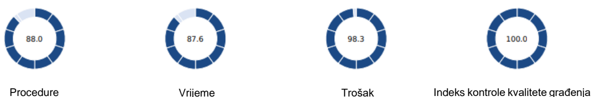
SLIKA 5: Rezultati rješavanja građevinskih dozvola u Hong Kong

OSC osoba dobiva relevantne potvrde i dozvole kao što su Potvrda vatrogasne službe, Dozvola za korištenje, Potvrda o usklađenosti i Potvrda o opskrbi vodom. Na kraju, OSC koordinira zajedničku i konačnu inspekciju relevantnih tijela za izdavanje licenci. Tijekom ovog procesa, također se postiže priključak na vodu, što se obavlja tijekom konačne inspekcije. Ovisno o ispunjenju tehničkih uvjeta, priključak na vodu može se dobiti istog dana. Ovaj sveobuhvatni proces omogućuje osobi da dobije sve potrebne građevinske dozvole i potvrde uz koordinaciju putem One Stop Centra, čime se olakšava administrativna strana građevinskih projekata u Hong Kongu. Sveukupan trošak dobivanja građevinske dozvole iznosi otprilike 8200 eura te traje 69 dana.