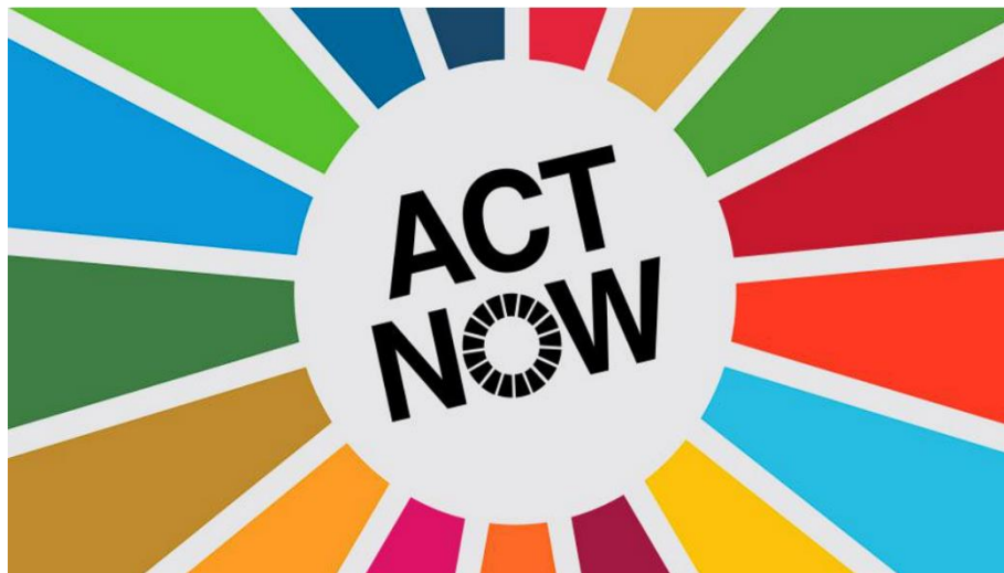
Slika 1. UN Kampanja ActNow, ( https://www.un.org/en/actnow )

Ostvarivanje uravnoteženog odnosa s okolinom ključno je za dugoročni uspjeh u poslovanju. Ako kompanija kao cilj ima dugotrajnu uspostavu na tržištu, potrebno je i usmjeriti dio resursa na osiguranje društvenog blagostanja i poslovati u skladu s dobrobiti zajednice jer bez okoline nema ni poslovanja. Najistaknutiji problemi današnjice nastali kao rezultat naglog civilizacijskog i tehnološkog razvoja su globalno zatopljenje, rapidno trošenje prirodnih resursa i posljedično uništavanje ekosustava, problemi koje svaki poslovni subjekt mora imati na umu kako bi postigao održivi razvoj. Vođene su mnoge kampanje i međunarodni sastanci u svrhu mobilizacije poslovnih subjekata, specijaliziranih stručnjaka i menadžera i povećanju svijesti o aktualnim globalnim problemima. Jedna od trenutno aktivnih kampanja je UN-ova ActNow kampanja čija je glavna zadaća educirati o promjenama pojedinci mogu unijeti u svakodnevnom životu kako bi se postigao održivi razvoj u kolaboraciji sa svjetski poznatim brendovima poput Netflix-a, DreamWorks-a i Sony Pictures-a. Logo kampanje je vidljiv iz priložene slike (Matutinović, 2016).