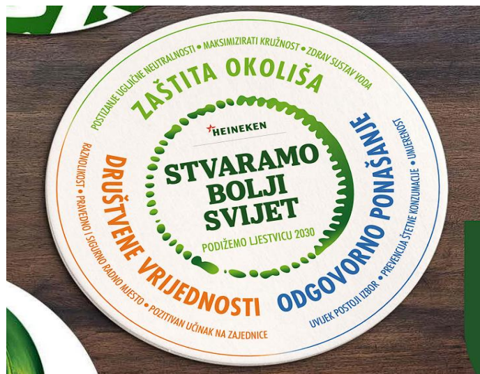
Slika 2. Heineken Projekt “Stvaramo bolji svijet”, ( https://heineken.hr/sustainability )

Također, shvaća svoju ulogu i utjecaj na mlade ljude kao proizvođač alkoholnog pića te nastoji educirati o odgovornoj konzumaciji alkohola putem radionica primarno za roditelje srednjoškolaca u suradnji sa psihološkim centrom Tesa projektom “Za odgovorno odrastanje mladih”. Kao dio kampanje odgovorne konzumacije, u ponudu stavlja i bezalkoholne alternative Heineken i Karlovačko 0.0.