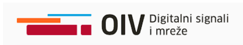
Slika 5. Logo Odašiljači i veze d.o.o., ( https://oiv.hr/hr/o-nama/ )

Nadalje, uzimajući u obzir industriju unutar koje kompanija djeluje, postavljeni su ciljevi za poboljšanje zaštite okoliša odgovornim raspolaganjem generiranog otpada, redovitim kontrolama opreme i mrežnih instalacija i aktivnim razmatranjem novih načina ekološki prijateljskog poslovanja. Kako je pitanje utroška energije vrlo aktualna tema u poslovnom svijetu, uvedene su promjene kako bi se smanjile emisije CO 2 , smanjuje se potrošnja ekstra lakog loživog ulja te su prerađene brojne interne infrastrukture kako bi se odgovornije upravljalo električnom energijom. Naponi kompanije u provođenju definirane politike zaštite okoliša se vidi i primljenim certifikatom ISO normi 50001. Usmjerenost stvaranju društvene vrijednosti vidljiva je i prema sustavu sponzorstva i donacija predajom Zahtjeva za sponzorstvo ili donaciju uz godišnja izvješća provedenih donacija i sponzorstva. Logo same tvrtke je vidljiv u nastavku.