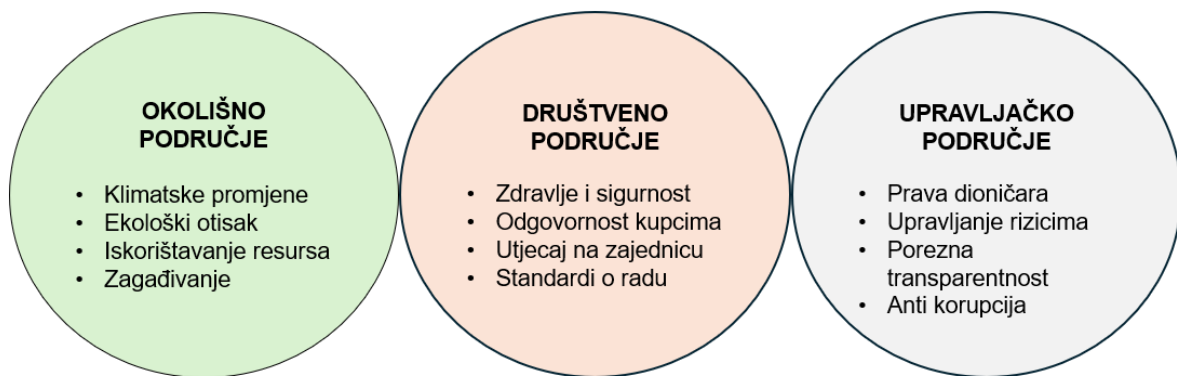
Slika 2: Područja ESG ocjene

Svaki od ESG čimbenika ima svoja područja ocjenjivanja a ona su prikazana u nastavku na Slici 3.