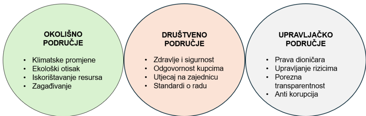
Slika 2: Područja ESG ocjene

Svaki od ESG čimbenika ima svoja područja ocjenjivanja a ona su prikazana u nastavku na Slici 3.