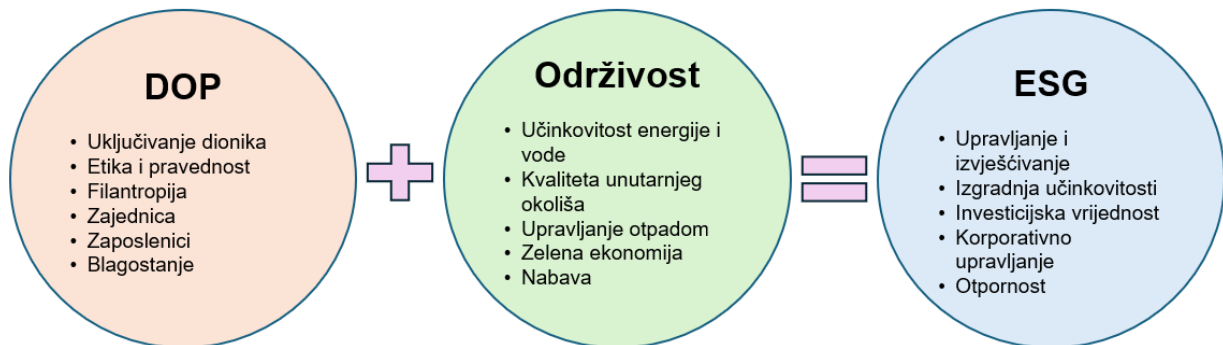
Slika 1: Odnos DOP-a, održivosti i ESG-a

Prema Hadicku (2018), spoj elemenata DOP-a i održivosti čini ESG odnosno njegove glavne elemente, karakteristike i aktivnosti na koje se fokusira, a to se prikazuje na Slici 1 u nastavku.