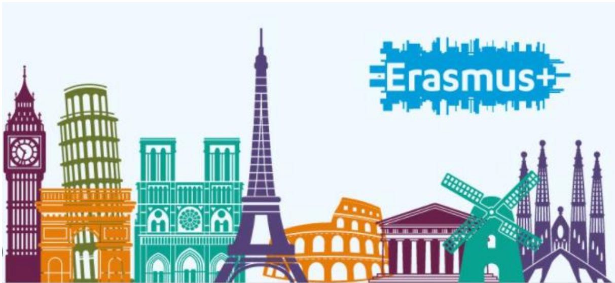
Slika 10: Erasmus +

Promicanje međunarodne suradnje u obrazovanju kroz razmjenu studenata, zajedničke projekte i koprodukcije s europskim i azijskim institucijama, kako bi se osnažila kulturna raznolikost i globalna konkurentnost hrvatskih stručnjaka.