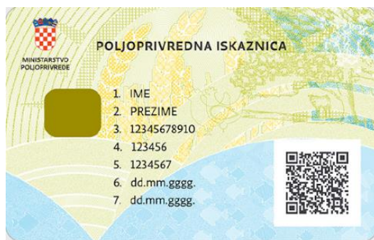
Slika 2 Poljoprivredna iskaznica

Nakon provedenog upisa i predane potpune dokumentacije, dobiva se iskaznica OPG-a koje je prikazana u nastavku. (Ministarstvo poljoprivrede, šumarstva i ribarstva, bez dat.)