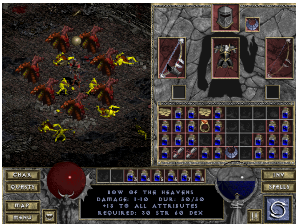
Slika 4: Diablo 1 [43]

Osim prvog online RPG-a veliku inovaciju je pružila igra Diablo i njen nastavak. Igra je uvela nasumično generirane tamnice i premete i time produžila vijek trajanja igranja zbog raznovrsnosti likova, tamnica i predmeta, gdje su igrači mogli ponovno igrati drugačije priče i scenarije [2].