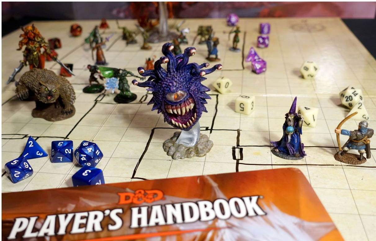
Slika 1: Dungeons & Dragons igra [40]

Same početke MMORPG igara i njihove subkulture možemo pratiti kroz nekoliko ključnih faza i faktora koji su utjecali na razvoj, počevši od samih korijena u tradicionalnim igrama uloga (eng. Role playing games) zasnovane na olovci i papiru poput Chainmail (1971.) koju nasljeđuje igra Dungeons & Dragons (D&D) i knjigama u stilu „Izaberi svoju avanturu“ koje su pratile te igre [10]. Dungeons & Dragons je prvi put objavljen 1974. godine, a klasičan je primjer igre gdje igrači preuzimaju uloge likova i koriste maštu i pravila za vođenje avantura. Ova igra je bila temelj za kasniji razvoj digitalnih i online igara uloga [5]. Također veliki utjecaj su imale i „multi-user dragons“ igre (MUDs), koje predstavljaju rane računalne tekstualne avanture koje su se pojavile oko 1980-ih godina. MUD-ovi su omogućili igračima da istražuju virtualne svjetove, razvijaju svojeg lika i provode interakciju s drugim igračima, i time postavili temelje za današnji standard online igranja u MMORPG-ovim [2].