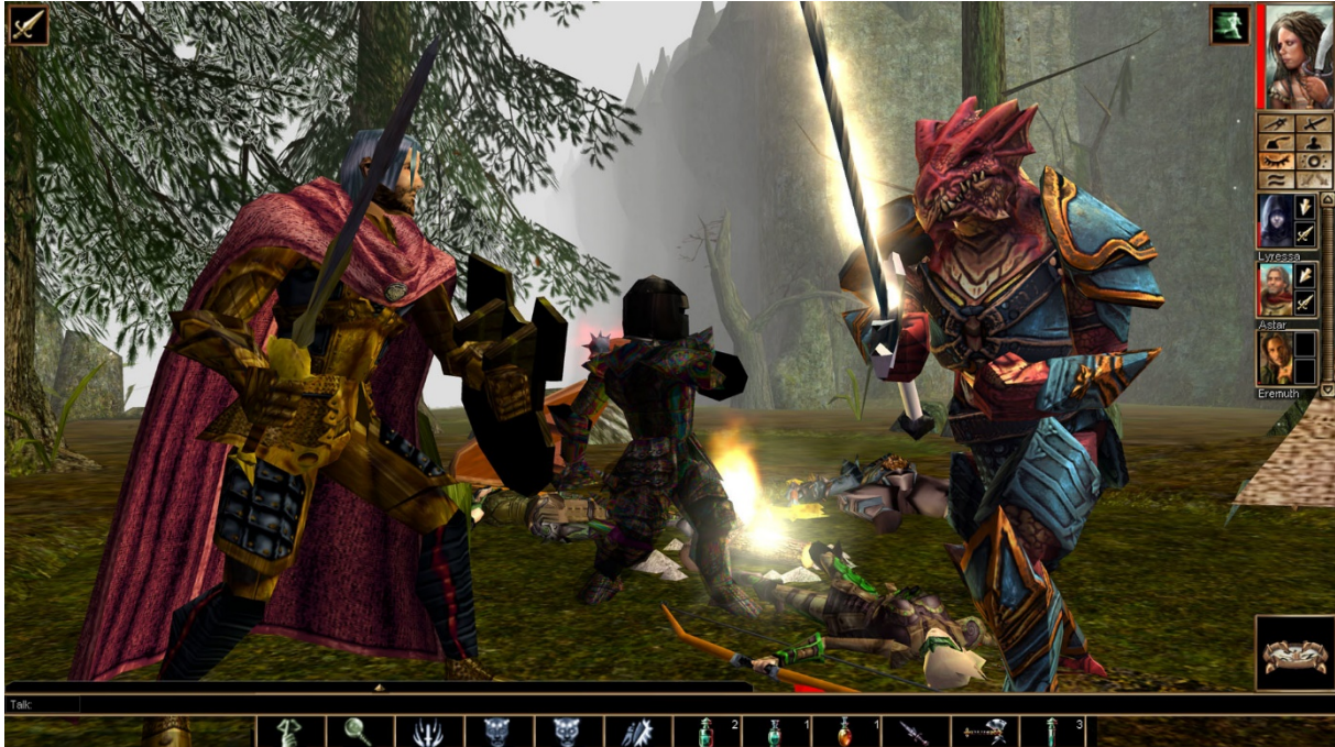
Slika 5: Neverwinter nights (2002) [44]

Također i nova verzija prvobitnog Neverwinter Nights-a omogućila je da igrači kreiraju vlastite sadržaje i mnogi stručnjaci i razvojni programeri smatraju ovo mogućnost kao velikom inovacijom koja čini MMORPG igre dugovječnije i time produljuje popularnost i postojanje žanra MMMORPG igara [2].