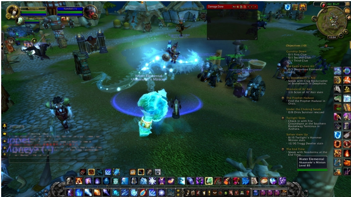
Slika 6: World of Warcraft [45]

Treća fazu razvoja MMORPG-ova proteže se od sredine 2000-ih do danas, a obilježena je novim tehnologijama i diversifikacijom. Igre poput Guild Wars 2 (2012), The Elder Scrolls Online (2014) i Final Fantasy XIV (2013) pokazale su kako se žanr modernizira prema očekivanjima igrača. Guild Wars 2 istaknuo se dinamičnim svijetom i privukao igrače jer je igra bila besplatna, dok su druge tražile mjesečnu pretplatu. The Elder Scrolls Online donio je popularni svijet Elder Scrolls franšize u online multiplayer format i time omogućio da igrači zajedno istražuju raznovrstan svijet s drugim igračima, a Final Fantasy XIV svojim kontinuiranim poboljšanjima stekao lojalnost igrača nakon prvobitnog neuspjeha u 2010. godini omogućujući igračima da istražuju Tamriel zajedno s drugim igračima, dok je Final Fantasy XIV svojim kvalitetnim sadržajem i kontinuiranim poboljšanjima stekao veliku lojalnost igrača nakon inicijalnog neuspjeha u 2010. godini [2].