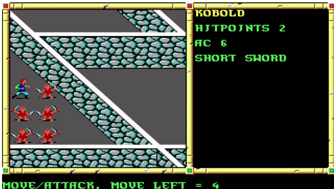
Slika 3: Neverwinter Nights 1991 [42]

Osim prvog online RPG-a veliku inovaciju je pružila igra Diablo i njen nastavak. Igra je uvela nasumično generirane tamnice i premete i time produžila vijek trajanja igranja zbog raznovrsnosti likova, tamnica i predmeta, gdje su igrači mogli ponovno igrati drugačije priče i scenarije [2].