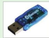
Slika 12. Bluetooth adapter za bežično povezivanje

Uvježbajte osnovne i dodatne dijelove računala: 1g1kviz1 .